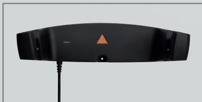
Caricatore da parete CW1 [05]